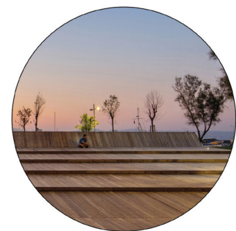
Quai en platelage bois